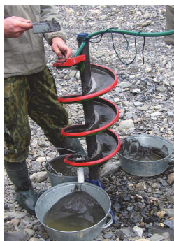
Նկ. 3. Մանր թանկարժեք միներալների կորզման համար լաբորատոր պարուրածն զտիչներ