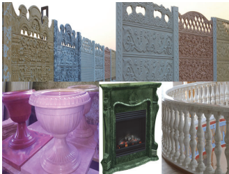
Դեկորատիվ բետոնի արտադրատեսակներ