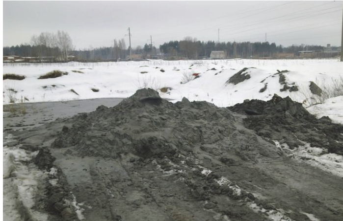
Նկ. 1. Քարամշակումից առաջացած մանրադիսպերս թափոններ (նկարը վերցված է համացանցից)

Քանի որ դեկորատիվ սալիկների բալաստային հումքը (քարափոշին) արդեն իսկ գտնվում է մանր-դիսպերս վիճակում, այն թույլ է տալիս առանց լրացուցիչ մանրացման, այլ բաղադրանյութերի հետ համապատասխան տեխնոլոգիաներով մշակելուց հետո, ստանալ առաջադրված հատկություններով օժտված արտադրանք [1]: