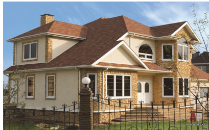
Նկ. 2. Դեկորատիվ բետոնի սալիկներ

Կարելի է կազմակերպել նաև այլ արտադրատեսակների արտադրություններ՝ բազրիքներ, աստիճաններ, վրացարանակոնքեր, արհեստական մարմարե գերեզմանաքարեր և այլն: