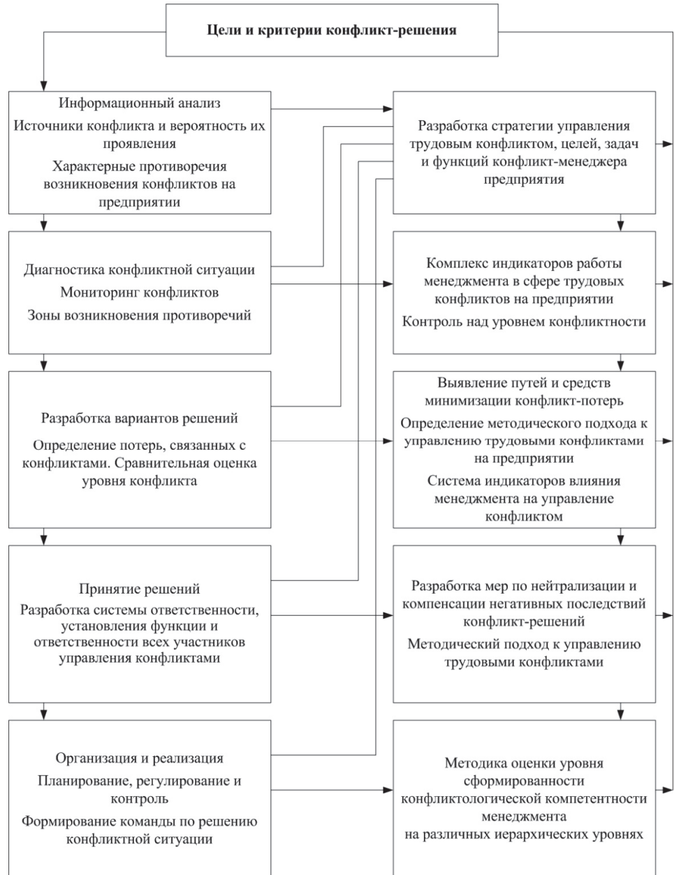
Рис. 3. Схема управления трудовыми конфликтами в процессе выработки реализации конфликт-решения

В технологию процесса управления конфликтами входит система индикаторов оценки поведения в конфликтной ситуации, рекомендуемых автором, с разными значениями для каждого уровня (рис. 3).