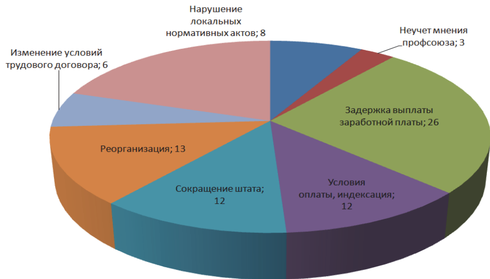
Рис. 1. Причины обращений в среднем за 2010–2016 гг., % от общего количества [4]

В среднем за период с 2010 по 2016 год наиболее часто встречающаяся причина начинающихся конфликтов — задержка выплаты заработной платы, которая составила 26% от общего числа. На втором месте — попытки работодателя в одностороннем порядке изменить либо не исполнить какой-либо пункт коллективного договора, а также споры по поводу условий нового коллективного договора (рис. 1).