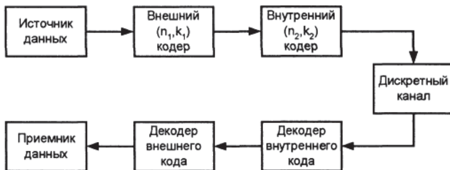
Рис. 2. Схема каскадного кодирования

Очень часто в каскадных кодирующих конструкциях кодеки блоковых РС кодов используют в качестве внешнего кодера, так как они имеют оптимальные характеристики как для одиночных, так и для пакетных ошибок [3]. Для внутреннего кодирования обычно используют сверточные коды, для декодирования которых применяется оптимальный алгоритм Витерби. Однако декодеры Витерби имеют выраженную тенденцию к размножению и пакетированию ошибок, когда вероятность их появления начинает превышать определенный предел. Поэтому в данной схеме между компонентными кодами включаются устройства перемежения и восстановления, осуществляющие перестановку символов по определенным правилам. Перемежители позволяют эффективно декоррелировать ошибки (разорвать между ними статистические связи) в канале, т.е. преобразовать пакеты ошибок большой кратности в одиночные. В случае идеального перемежения ошибки на входе декодера РС будут независимыми, и он реализует свою максимальную корректирующую способность. Характеристики часто используемого каскадного кода, состоящего из кода Рида-Соломона (204,188), сверточного кода с K=7 и перемежителя, представлены на рис.1 (кривая 6).