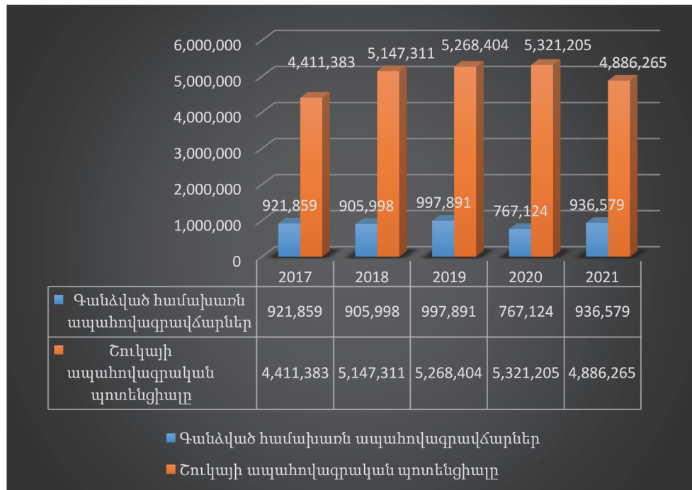
Նկ. 2. 2017-2021թթ. բեռների ապահովագրության գծով գանձված ապահովագրավճարները և շուկայի ապահովագրական պոտենցիալը, հազար ՀՀ դրամ

Ինչպես երևում է Ազգային վիճակագրական ծառայության տվյալներից, արտահանման և ներմուծման ապրանքաշրջանառության ոլորտում կա բեռների ապահովագրության մեծ պոտենցիալ, որը կարող են ներառել ՀՀ ապահովագրական ընկերությունները: Բացի դրանից, բեռի ապահովագրության գծով ՀՀ ապահովագրական շուկայի պոտենցիալի ավելացմանը կարող են նպաստել նաև ներքին բեռնափոխադրումների ապահովագրության մշակույթի ձևավորումն ու զարգացումը: Հայաստանյան շատ ընկերություններ, որոնք իրենց գործունեությունն իրականացնում են տնտեսության տարբեր ճյուղերում, կարող են բեռնափոխադրումների ապահովագրությունը կիրառել որպես պոտենցիալ կորուստների նվազման միջոց: