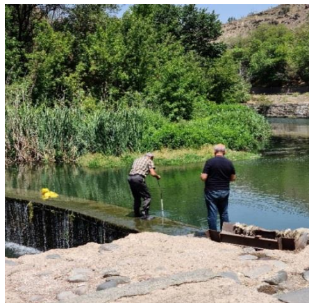
Рис. 2. Измерения на плотине с одним падением