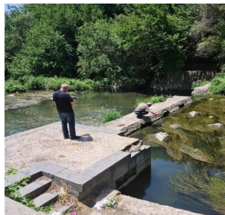
Рис. 4. Наполненный наносами и покрытый водорослями верхний бьеф

В то же время на рассматриваемом участке реки имеются серьезные экологические, технико-экономические проблемы. Результаты наблюдения показывают, что объемы перед сооружениями в основном занесены наносами и водорослями (рис. 4), а прибрежные зоны покрыты густой массой кустарников и тростника, заболочены и замусорены.