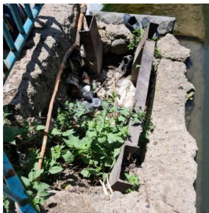
Рис. 3. Засорение клапанного узла